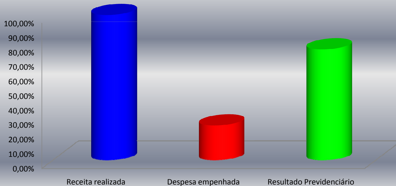
Receitas Arrecadadas x Despesas Empenhadas Fevereiro/2016