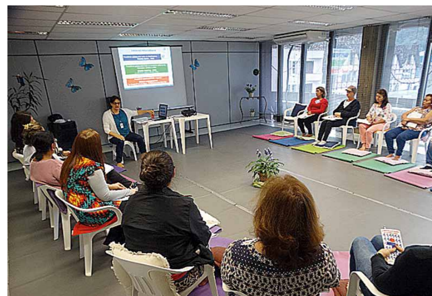
Encontros voltados ao acesso às informações previdenciárias e momentos de reflexão que favoreçam a estratégia pessoal

COMO SE INSCREVER NO PPA – O programa é disponibilizado ao servidor que está há dois anos ou menos de acessar uma das regras de aposentadoria. Essa informação pode ser verificada através de uma simulação realizada, a pedido do servidor, pela equipe do setor de Previdência do Ipreville, de segunda a quinta-feira das 8 às 14 horas e sexta-feira das 8 às 12 horas ou solicitada através do e-mail presidente@ipreville.sc.gov.br . A inscrição no PPA pode ser feita pelo telefone 3432-9098, das 8 às 14 horas.