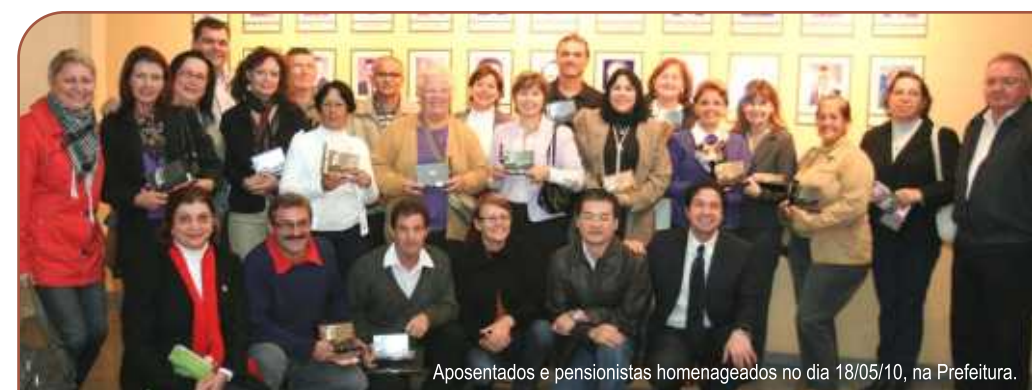
Aposentados e pensionistas homenageados no dia 18/05/10, na Prefeitura.