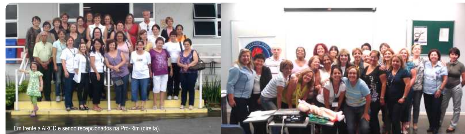
Em frente à ARCD e sendo recepcionados na Pró-Rim (direita).

As inscrições para as oficinas do 2º semestre estarão abertas do dia 19 a 23 de julho, das 8 às 14h, no Ipreville. Informações pelo telefone 3423.1900 ou pelo e-mail rita@ipreville.sc.gov.br