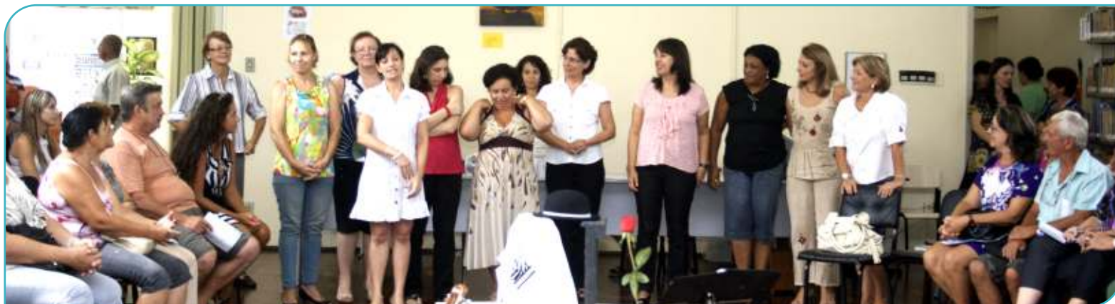
INTERAÇÃO: voluntários se apresentam aos mais de 50 participantes das oficinas durante lançamento do projeto na Biblioteca Municipal