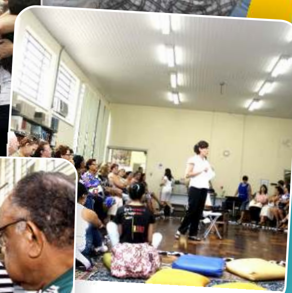
ENERGIA: encontro proporcionou interação entre o grupo com dinâmica de brincadeiras.