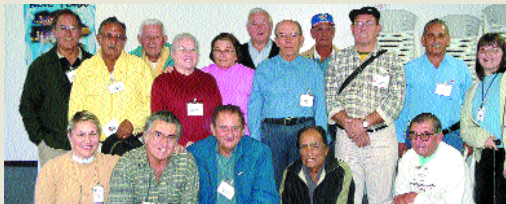
Servidores com idade próxima dos 70 anos são preparados para nova fase com a aposentadoria

um dos instrumentos utilizados neste trabalho que complementa as orientações e dinâmicas de grupo que ocorrem em reuniões mensais.