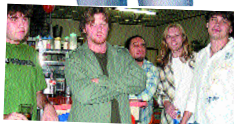
O CD está disponível na Rock Total Discos (Rua Henrique Meyer, 61 - Centro - Joinville-SC) e através do email: osdepira@terra.com.br

O repertório dos shows é composto de músicas próprias e dos discos da fase racional de Tim Maia, Iados B de Mutantes, Roberto Carlos, The Doors e outros.