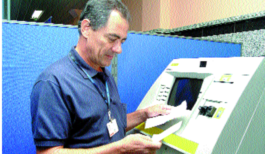
Em abril, servidores da ativa terão desconto de 11% em seus proventos

Vale fazer um importante registro nesse processo de adequação às novas regras da reforma da previdência. Quando o Ipreville fez as contas durante a última avaliação atuarial, ficou claro que para o servidor não ter que arcar com uma alíquota superior a 11%, a Prefeitura teria de manter a relação 2 x 1 entre a contribuição do município e a dos segurados. Nesse aspecto foi decisiva a participação do prefeito Marco Tebaldi, pois determinou a manutenção de 2 x 1, dando provas de seu reconhecimento da importância para o município de ter um regime próprio de previdência perfeitamente equilibrado e com boa saúde financeira. Mais que isso, cumpre o que estabeleceu em seu plano de governo: a valorização do servidor público municipal de Joinville.