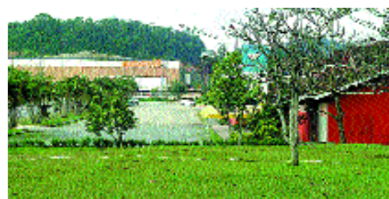
Expoville: venda de volta à Prefeitura por R$ 18,1 milhões