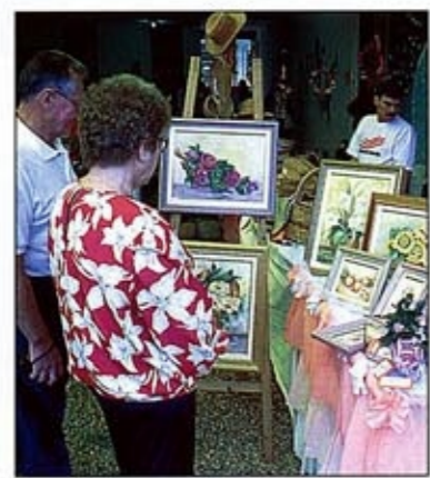
Servidores fazem a feira há sete anos

Desde sua criação, em 1996, o Ipreville tem em sua estrutura orgânica os conselhos administrativo e fiscal, cujos membros são eleitos pelos servidores ou indicados pelo Executivo. Desde 1999, após a primeira reforma da previdência, lei municipal estabelece que todos os dirigentes do Ipreville têm de ser, obrigatoriamente, do quadro efetivo de servidores.