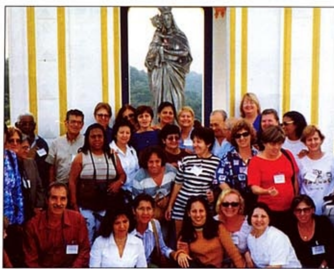
Grupo do Ipreville posa para foto durante passeio recreativo da Asapi

As associações sociais surgem de idéias que vão tomando forma e amadurecem com a reflexão e a discussão. A mentalização da filosofia e o delineamento dos objetivos traçam os rumos a serem atingidos. Foi através desse processo que, no dia 9 de outubro de 2001, foi criada a Asapi (Associação dos Segurados, Aposentados e Pensionistas do Ipreville).